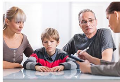
Elternberatung vor Scheidung nach § 95