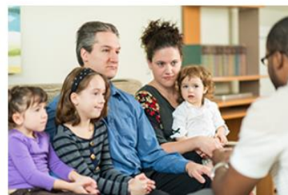
Eltern- und Kinderbegleitung