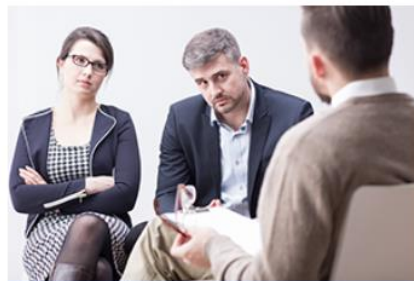
Familien- und Scheidungsberatung bei Gericht